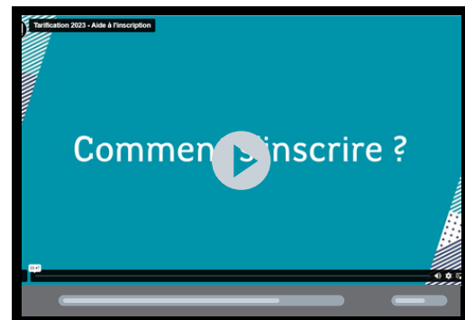
Le tutoriel d'inscription